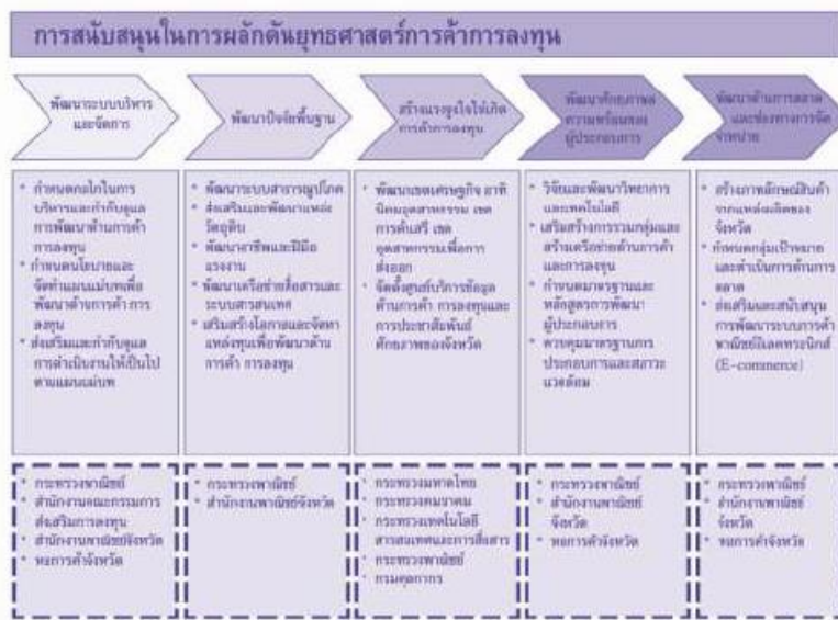
แผนภาพที่ 11: แสดงตัวอย่างของ Value Chain การผลักดันยุทธศาสตร์การคลังการลงทุน

ห่วงโซ่คุณค่า คือ สายโซ่ของกิจกรรมที่จะก่อให้เกิดคุณค่าต่อองค์กร เป็นเครื่องมือที่ช่วยในการทำความเข้าใจถึงบทบาทของแต่ละส่วนว่าจะมีส่วนช่วยเหลือให้องค์กรก่อกำเนิดคุณค่าได้อย่างไร เป็นการวิเคราะห์ความสัมพันธ์ระหว่างการดำเนินกิจกรรมต่างๆ ภายในจังหวัด/กลุ่มจังหวัด โดยแบ่งกิจกรรมภายในเป็น 2 กิจกรรมคือ กิจกรรมหลัก (Primary Activities) และกิจกรรมสนับสนุน (Support Activities) ซึ่งกิจกรรมทุกประเภทมีส่วนในการช่วยเพิ่มคุณค่าให้กับองค์กร ดังนั้น การจัดทำห่วงโซ่คุณค่าจะเป็นเครื่องมือที่ช่วยเรียงร้อยให้จังหวัดทราบกระบวนการและกิจกรรมต่างๆ ที่มีผลต่อความสามารถในการดำเนินงานของจังหวัด/กลุ่มจังหวัดในภาพรวมตั้งแต่ต้นน้ำจนถึงปลายน้ำ เพื่อที่จะร่วมกันจัดทำแผนในการแก้ไขและปรับปรุงการทำงานให้เหมาะสม