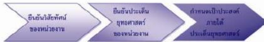
แผนภาพที่ 9: กระบวนการจัดทำแผนที่ยุทธศาสตร์

สำหรับการจัดทำแผนที่ยุทธศาสตร์ (Strategy Map) นั้นจะต้องมีองค์ประกอบที่สำคัญ คือ การพิจารณาถึงทิศทางของจังหวัด อันได้แก่ วิสัยทัศน์ ประเด็นยุทธศาสตร์ และเป้าประสงค์ภายใต้แต่ละประเด็นยุทธศาสตร์ ซึ่งจะต้องมีความเชื่อมโยงซึ่งกันและกัน โดยกระบวนการในการจัดทำแผนที่ยุทธศาสตร์นั้น มีอยู่ 3 ขั้นตอนหลัก กล่าวคือ